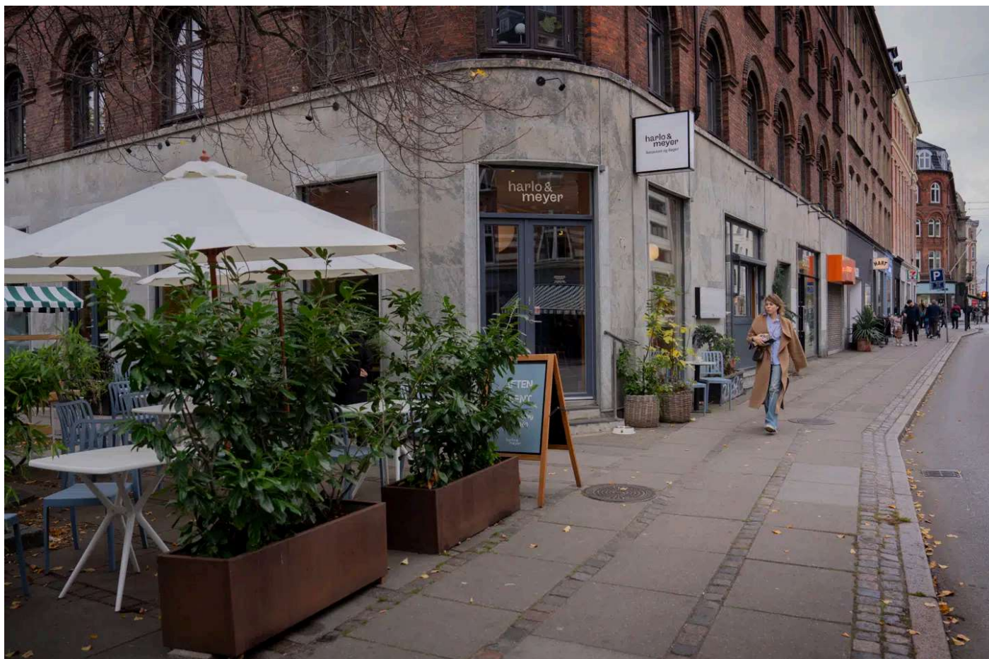
I dag ligger Harlo & Meyer her på hjørnet af Gl. Kongevej og Hauchsvej, men tidligere har Claus Meyer haft andre aktiviteter på samme adresse.

Jeg sad 1,5 meter fra nabobordet og overhørte på intet tidspunkt deres samtale, mens jeg uanstrengt kunne tale med min ledsager i et roligt og diskret toneleje.