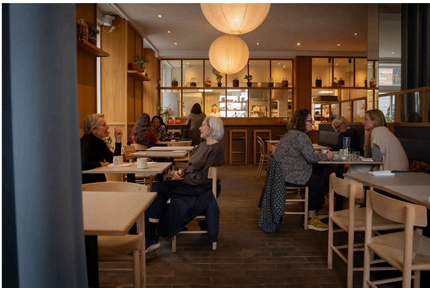
Harlo & Meyers restaurant med stort åbent køkken for enden er moderne og nordisk og med en god akustik.

Restaurant: Gl. Kongevej har fået endnu et kvalitetsspisested med altid foretagsomme Claus Meyer i kulissen. Flere elementer var i Michelin-klassen, men aftenen bød også på et svinsk kiks.