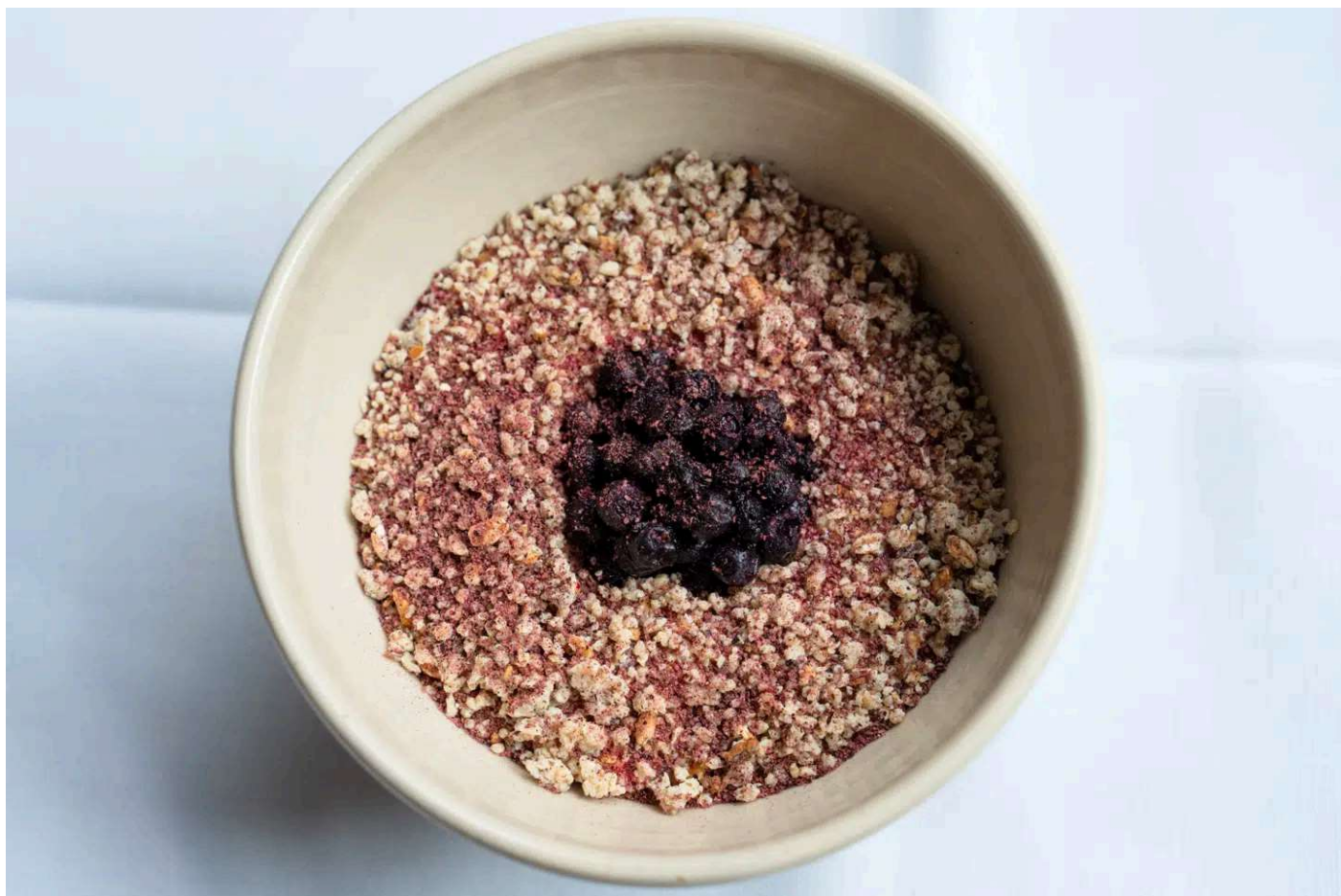
Harlo & Meyers vilde blåbær, yoghurt & ristede rugkerner. Fnuglet og frisk dessert, som enhver – også desserthaderen – bør prøve.

Vi var forbi Gl. Kongevej en onsdag aften, og der var nok halvt fyldt i lokalet, hvilket både kan skyldes, at det var hverdag, men måske også, at mange ikke ved, at Harlo & Meyer nu også har aftenåbent.