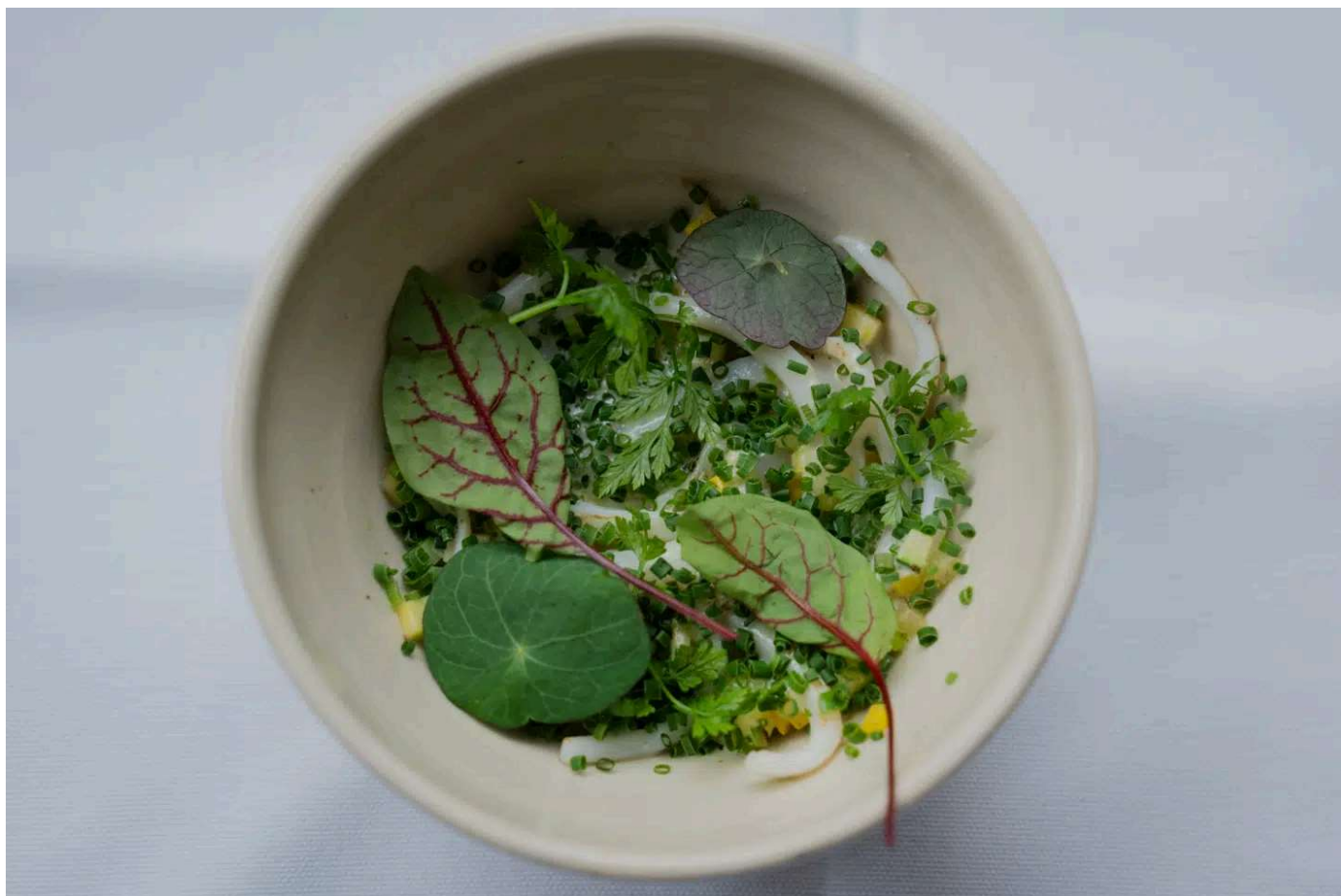
Dansk blæksprutte, strimlet som tagliatelle med grøn chili og courgette.

Den opmærksomme tjener spurgte, om vi ville have en lille pause inden »hovedretterne«. Betænksomt - og rart, at man ikke altid skal hastes igennem på en stille aften, hvor seating ikke er et problem.