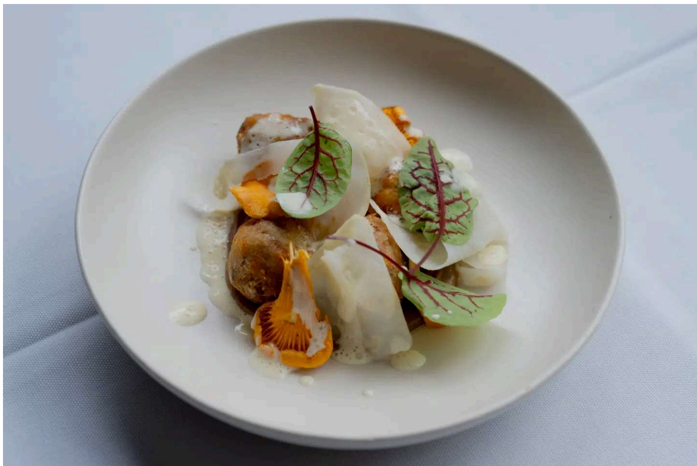
Brisler og kantareller – hvad mere kan man forlange?

Sprøde friterede brisler. Oh, lyksalige, fede, salte comfortfood-smage! God jordbunden syre fra syltet knoldselleri. Et par flotte kantareller, der godt kunne have været stegt en my hårdere. Men overordnet en rigtig herre-nugget med halstatovering – men så alligevel med velstrøget skjorte. Haps!