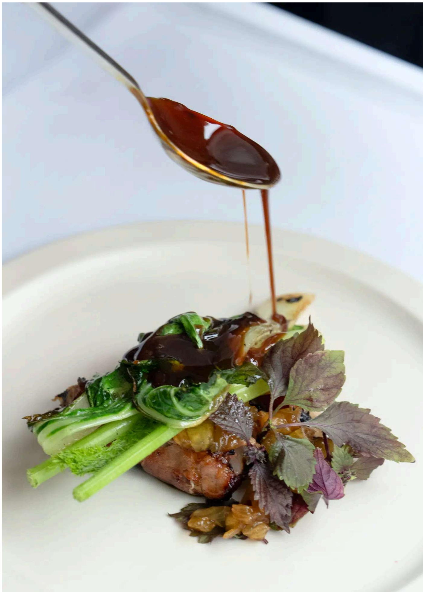
Harlo & Meyers yakitori-gris kom med noget af årets bedste garniture og en vidunderlig sauce. Desværre var konsistensen på grisen langt fra vellykket.

Sidste ret fra det salte køkken var Harlo & Meyers yakitori-gris, der allerede har været en del buzz omkring.