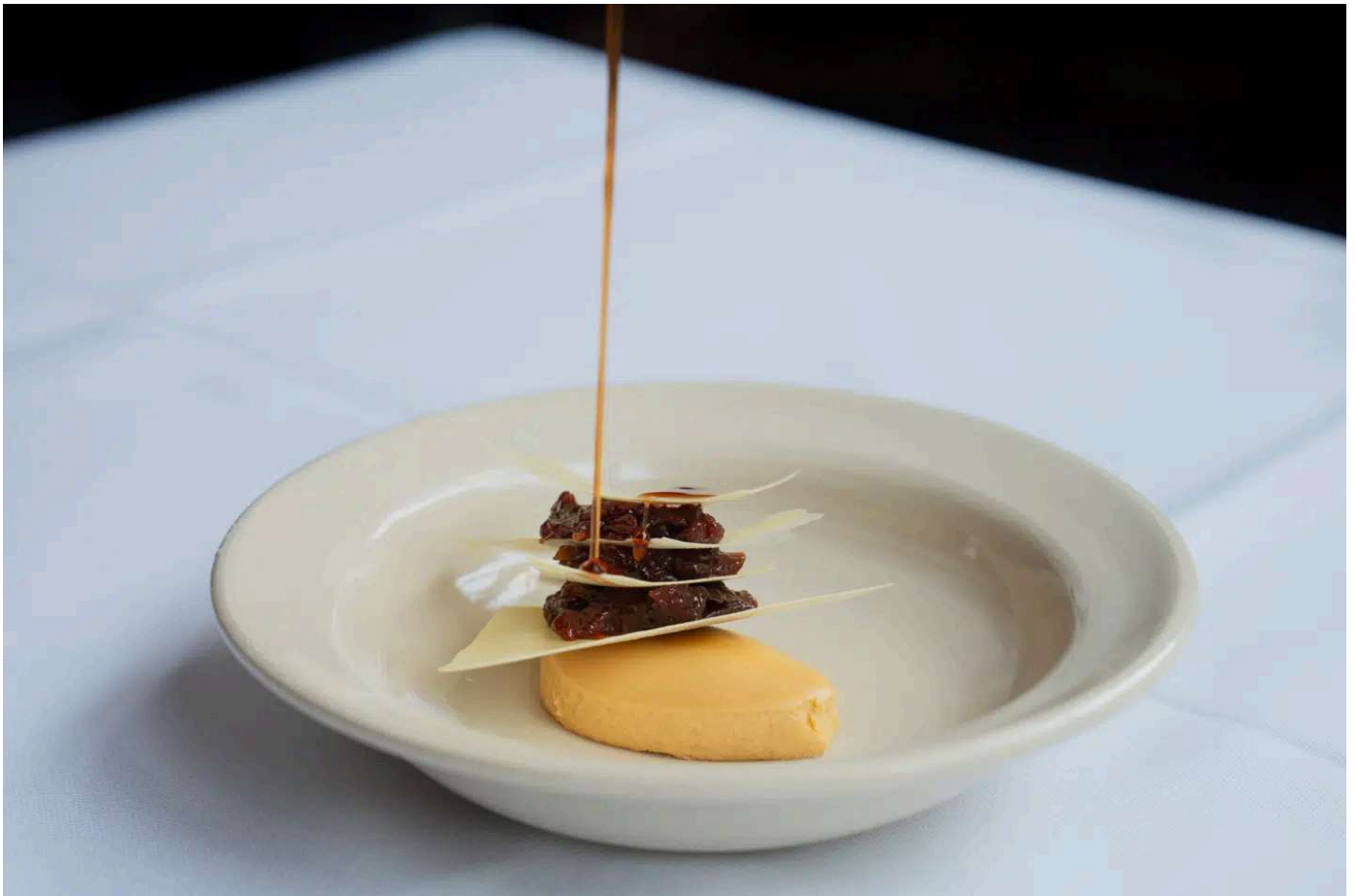
Opalblommer, karamel & crème anglaise. Let, raffineret og velmagende.

Vi kom dog hurtigt op på hesten igen med et par lækre og lette og elegante desserter.