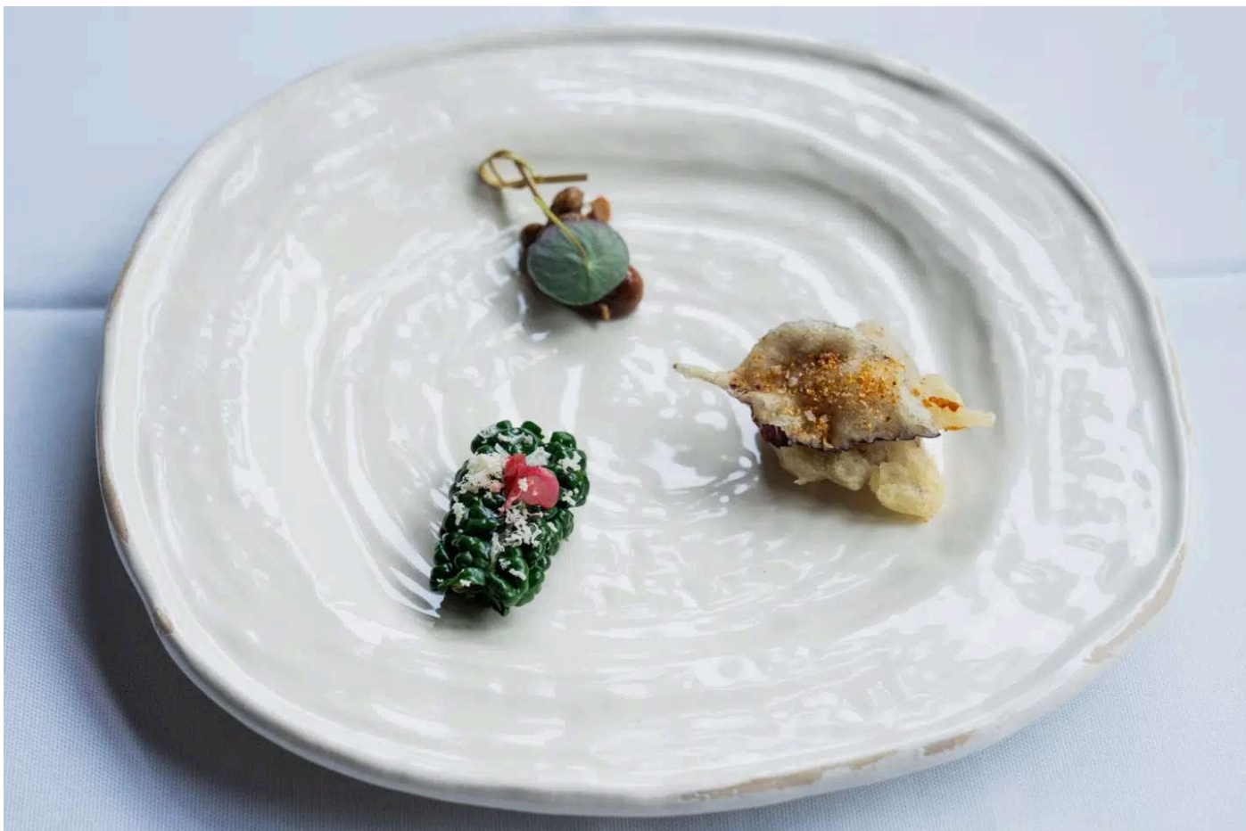
Snacks: Øverst grillede shiitakesvampe. Med uret: Friterede, aromatiske shisoblade og sidst (kl. 7) spinatrulle med tatar af rødfisk og rosenpeber.

Første ombæring var i menukortet blot anført som »snacks«.