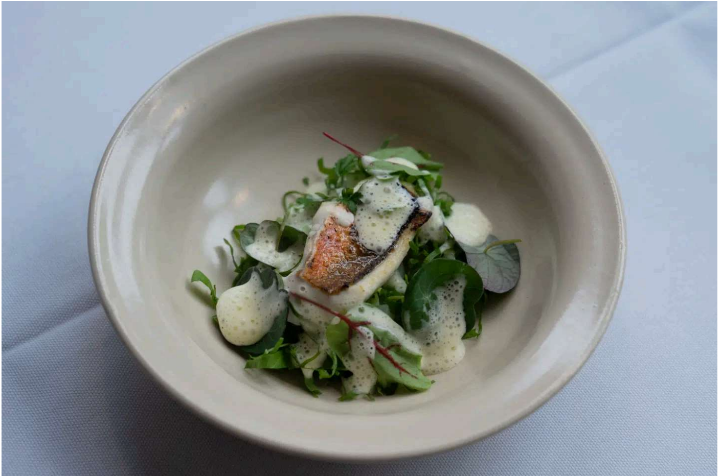
Harlo & Meyers knurhane er et studie i enkel, gennemtænkt velsmag.

Den perfekt stegte filet havde en overraskende intens velsmag - næsten som en hængt pighvar.