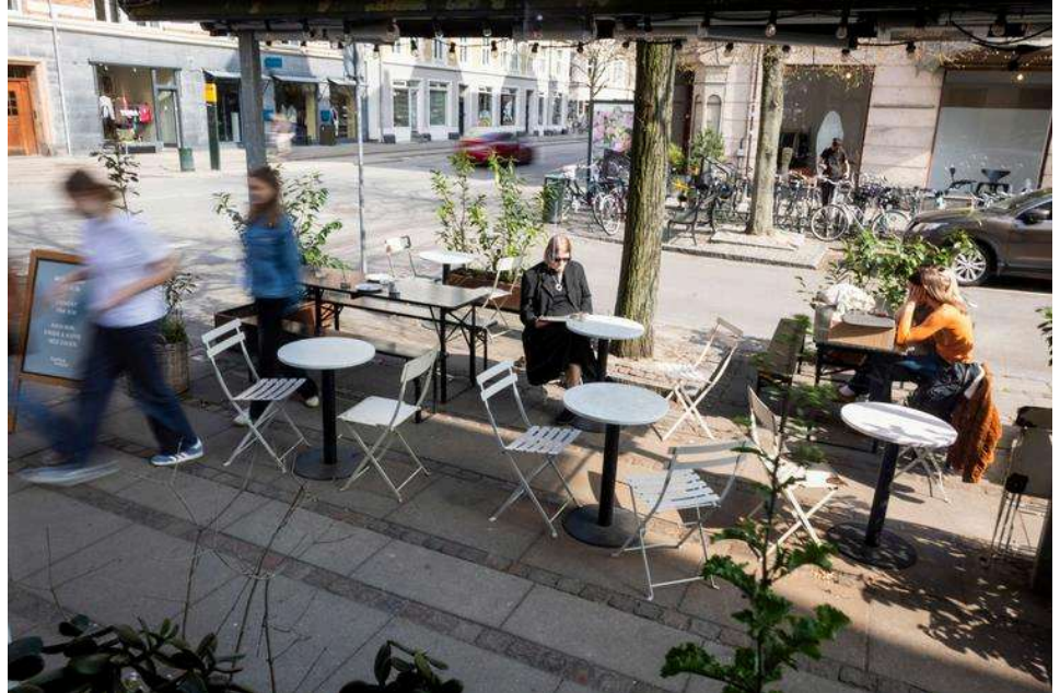
Hos Harlo & Meyer kan man både købe kaffe, bagerbrød og konditorkager to go eller tage plads til morgenmad og frokost ved hvide stofduge.

På hjørnet af Hauchsvej og Gl. Kongevej, hvor der i årtier har duftet af nybagte surdejsboller og kanelnurrer, er det, der var den originale Meyers Deli, siden Meyers Bageri, nu forvandlet til Harlo & Meyer. Men det er stadig et sted, hvor foodies, der kender smagen af mælk fra Søtofte, gris fra Birthesminde, æbler fra Lilleø og grønt fra Kiselgården, vil føle sig hjemme.